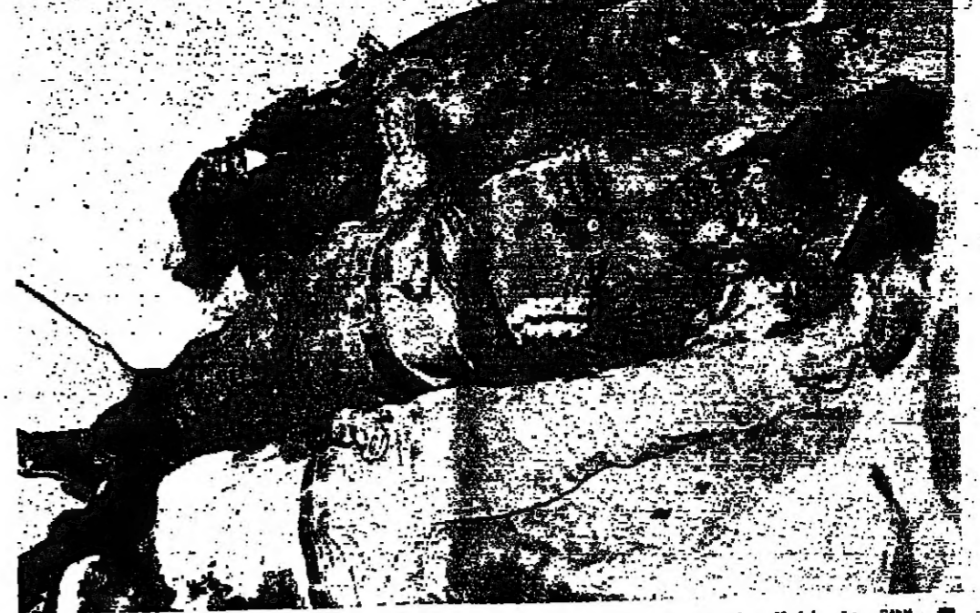
ثلاثة من ضحايا العدوان الوحشي على «مخيم البص» (تصوير تزيه تيزوي)